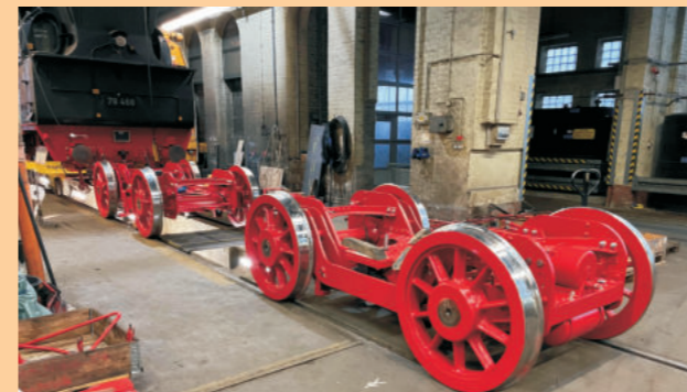
Die Drehgestelle sind fertig...